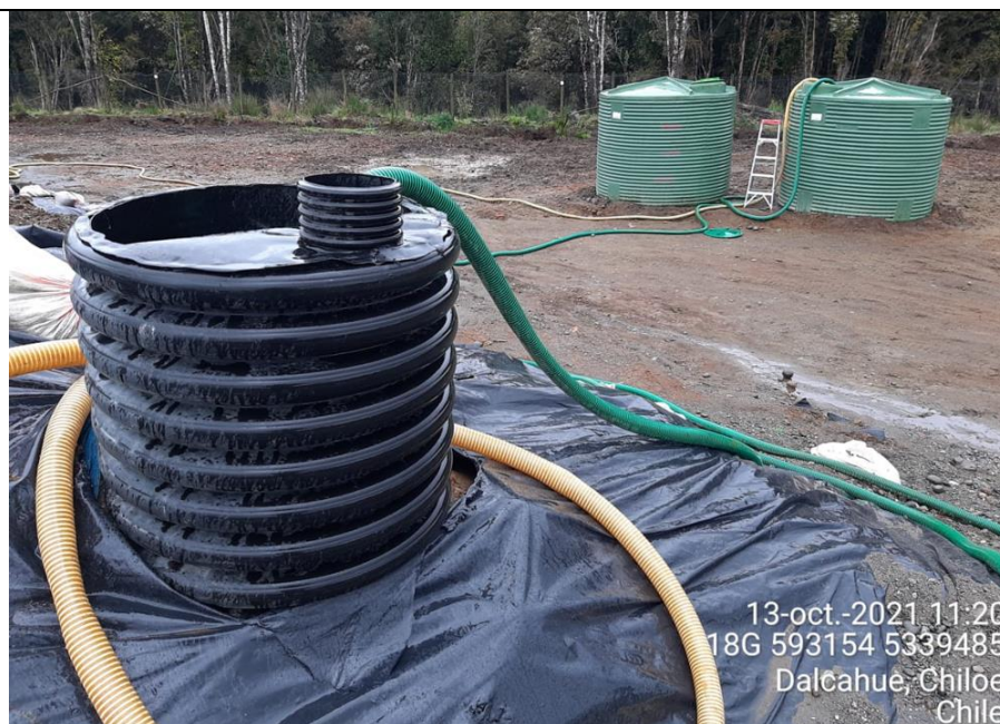
Fotografía N°5: Retiro de Lixiviados desde cámara C10 por Personal Municipal. Tomada: Miércoles 13 de Octubre del 2021.