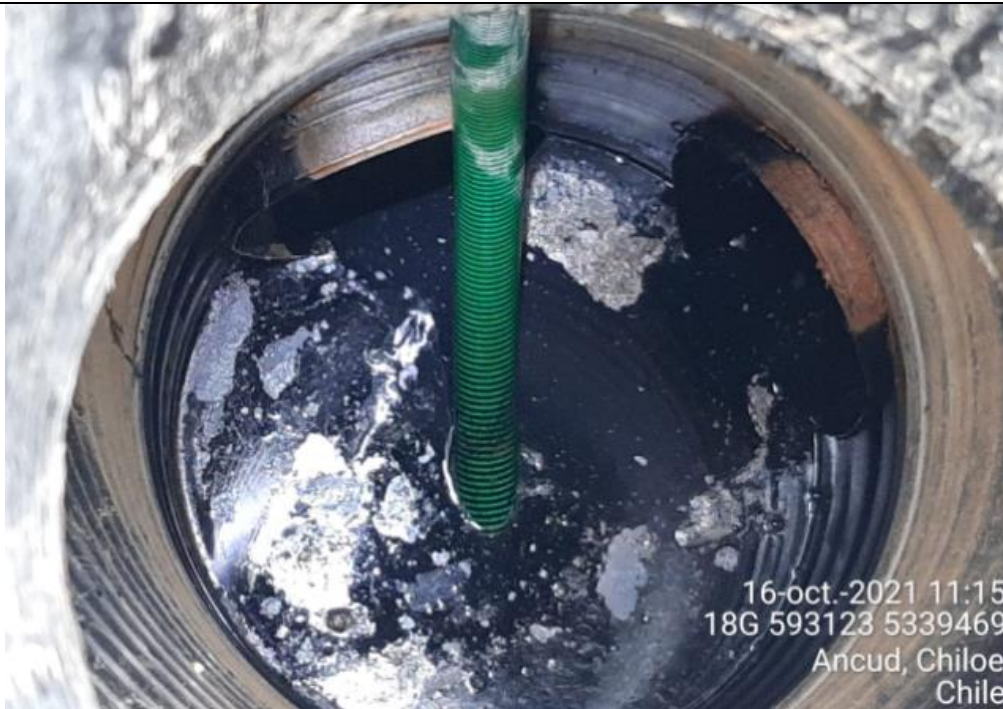
Fotografía N°12: Retiro de Lixiviados desde cámara C08. Tomada: Sábado 16 de Octubre del 2021