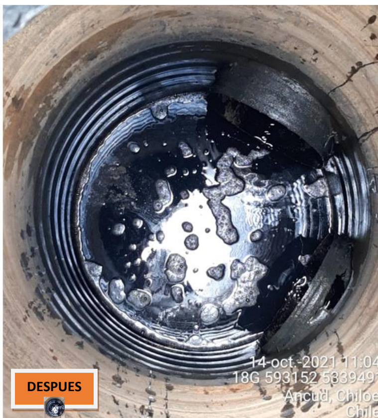
Fotografía N°8: Retiro de Lixiviados desde cámara Antes y Después de retiro. Tomada: Jueves 14 de Octubre del 2021