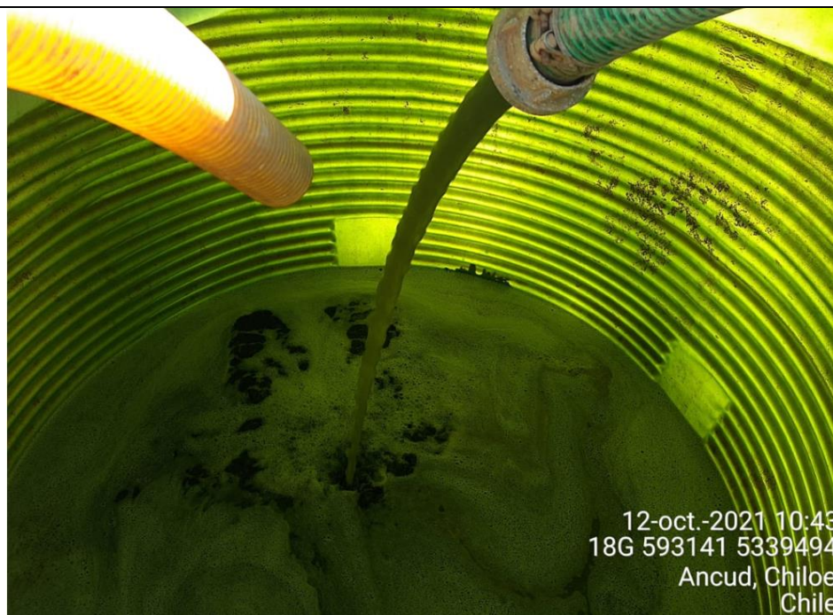
Fotografía N°4: Extracción de Lixiviados a estanque. Tomada: Martes 12 de Octubre del 2021.