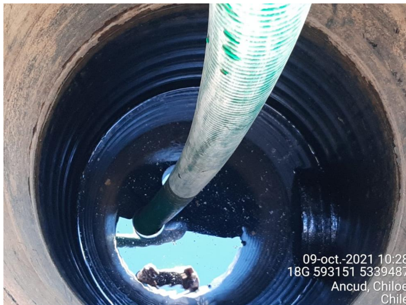
Fotografía N°1: Retiro de Lixiviados desde C10 por Personal Municipal. Tomada: Sábado 09 de Octubre del 2021.

Para dar cumplimiento a lo indicado en Res. Exenta N°2070, emitida con fecha 16 de Septiembre del 2021. A continuación, se presenta el registro fotográfico de las actividades de extracción de la semana que contempla el presente reporte.