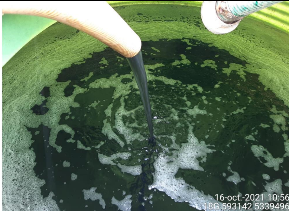
Fotografía N°11: Retiro de Lixiviados a estanque de acumulación. Tomada: Sábado 16 de Octubre del 2021