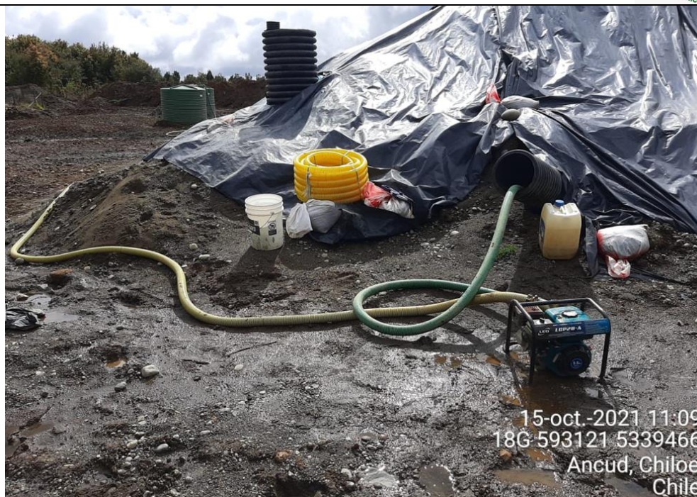
Fotografía N°9: Extracción de Lixiviados desde diagonal D04. Tomada: Viernes 15 de Octubre del 2021