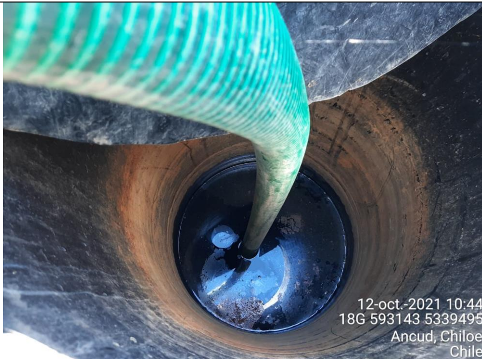
Fotografía N°3: Retiro de Lixiviados desde cámara C10 por Personal Municipal. Tomada: Martes 12 de Octubre del 2021.