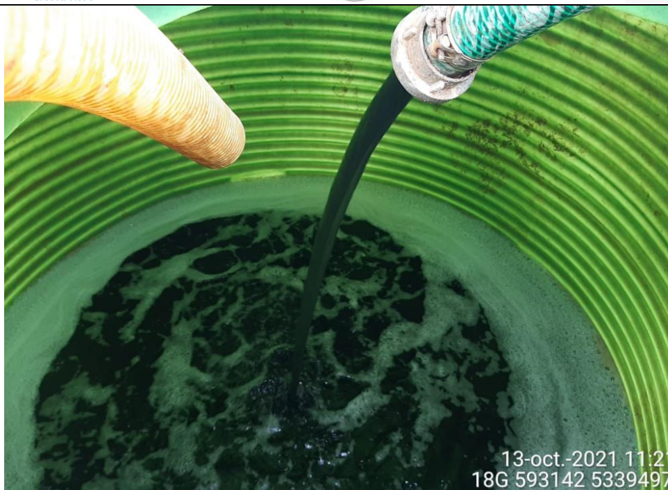
Fotografía N°6: Extracción de Lixiviados a estanque de acumulación. Tomada: Miércoles 13 de Octubre del 2021.