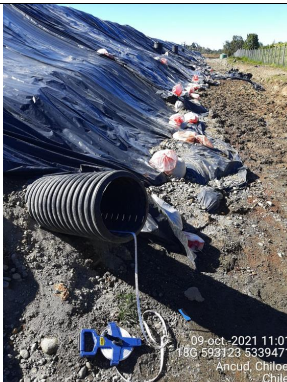
Fotografía N°15: Medición de Niveles de cámaras por Personal Municipal. Tomada: 09 de Octubre del 2021.