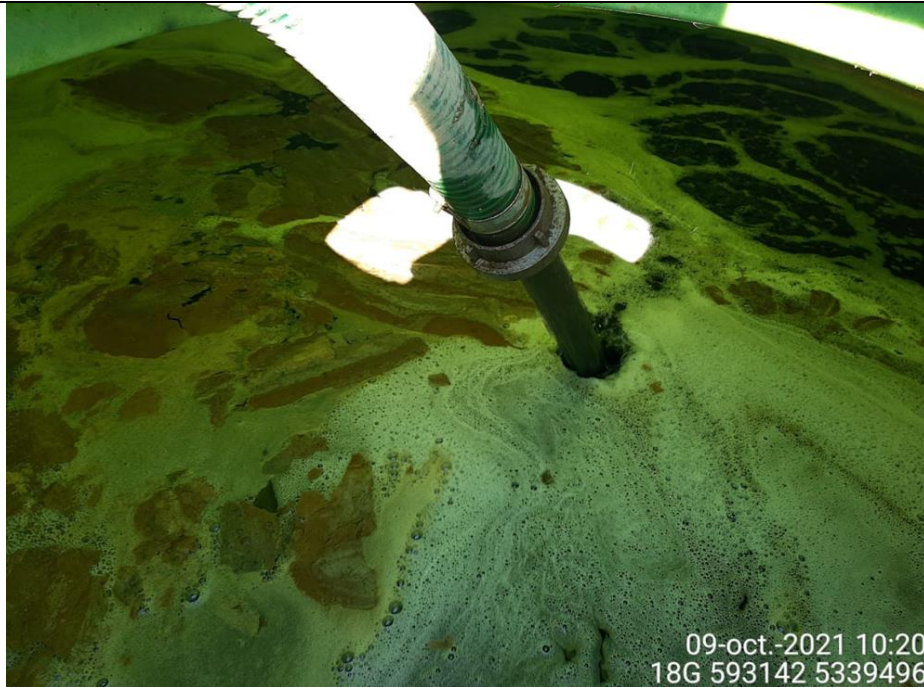
Fotografía N°2: Retiro de Lixiviados a estanque de acumulación por Personal Municipal. Tomada: Sábado 09 de Octubre del 2021.