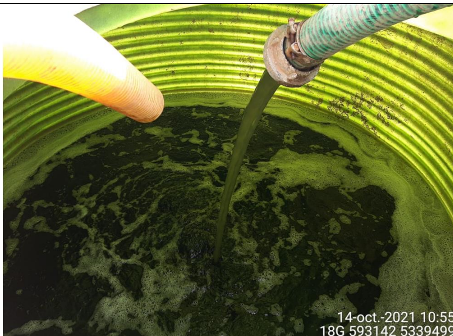
Fotografía N°7: Extracción de Lixiviados a estanque de acumulación. Tomada: Jueves 14 de Octubre del 2021