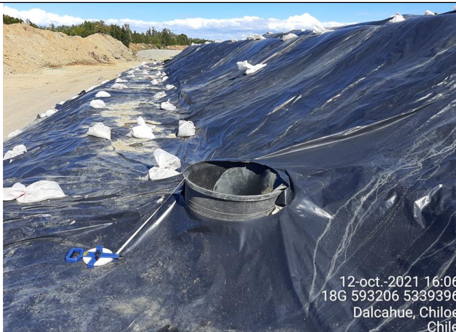
Fotografía N°16: Medición de Niveles de cámaras por Personal Municipal. Tomada: 12 de Octubre del 2021.