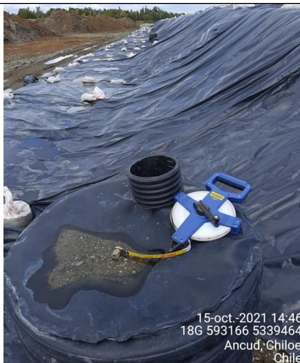
Fotografía N°18: Medición de Niveles de cámaras por Personal Municipal. Tomada: 15 de Octubre del 2021.