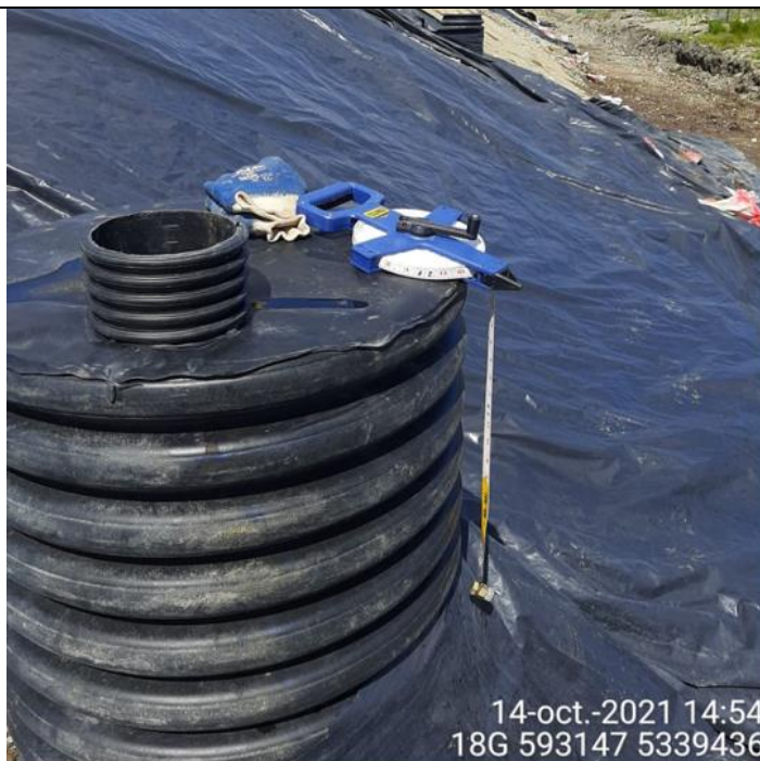
Fotografía N°17: Medición de Niveles de cámaras por Personal Municipal. Tomada: 14 de octubre del 2021.